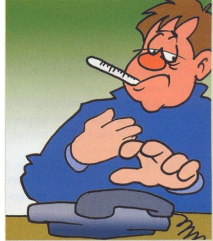
Ha a magas láz, a mellkasi fájdalom vagy a köhögés tüdőgyulladás gyanúját kelti, haladéktalanul orvoshoz kell fordulni

A becslések szerint az összes tüdőgyulladás mintegy felét vírusok okozzák. A légúti vírusfertőzések többsége csupán náthával vagy torokgyulladással jár, de némelyikük a tüdőt is megtámadja, különösen a gyermekek tüdejét. A vírusos tüdőgyulladások többsége nem súlyos, és hamar elmúlik.